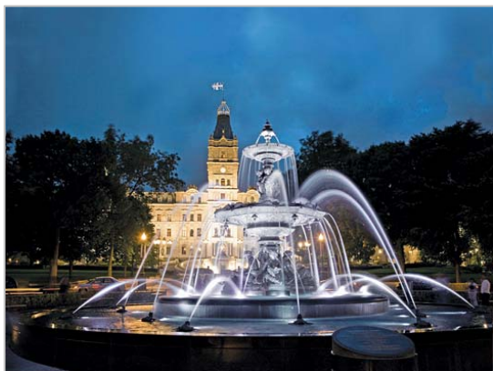
Fontaine de Tourny

La disponibilité des chambres du bloc à taux préférentiels est sur le principe du premier arrivé, premier servi. Ne tardez donc pas à réserver votre chambre !