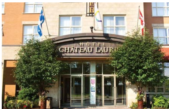
Hôtel Château Laurier Québec

Un bloc de chambres en style standard (134$/nuit + taxes) et européen ($114/nuit + taxes) est offert à des taux préférentiels en occupation simple ou double. Des frais de 20$/nuit sont applicables pour tout adulte supplémentaire. L'accès Internet haute vitesse sans fil est gratuit dans les chambres. Le stationnement intérieur est offert au tarif de 19$ par jour. Les réservations devront être effectuées individuellement par les congressistes au plus tard le 11 septembre par téléphone (1-800-463-4453), télécopieur (1-418-524-8768), courriel ( reservation@vieuxquebec.com ) ou en ligne ( www.vieux-quebec.com/fr/laurier ). N.B. Il est très important de préciser le code de groupe ACA5007 de notre événement lors de votre réservation.