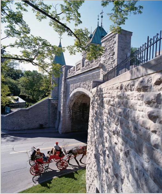
Porte (Gate) Saint-Louis

Acoustics Week in Canada 2011, the annual conference of the Canadian Acoustical Association, will be held in Quebec City from October 12 to 14. This premier Canadian symposium in acoustics and vibration will take place in beautiful Old Quebec, a UNESCO world heritage treasure with European appeal. You surely will not want to miss this event. The conference will include three days of plenary lectures and technical sessions on all areas of acoustics, a meeting of the Acoustical Standards Committee, the CAA Annual General Meeting, an Exhibition of acoustical equipment, materials and services, the Conference Banquet, an Award ceremony and other social events.