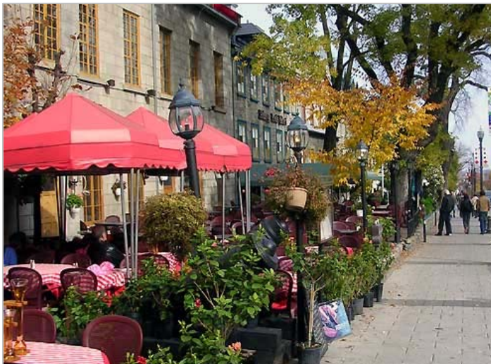
Rue (Street) Grande-Allée

Participation étudiante – La participation étudiante est fortement encouragée. Des subventions de voyages et des frais d'inscription réduits seront offerts. Des prix seront décernés pour les meilleures présentations étudiantes lors du congrès. La date limite d'inscription au concours est le 1 août 2011.