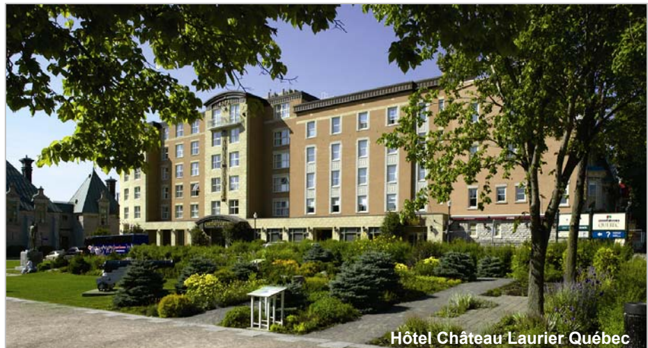
Hôtel Château Laurier Québec

Participants are strongly encouraged to stay at Hôtel Château Laurier Québec. Staying at the conference hotel will place you near your colleagues and all conference activities, and help make the meeting a financial success to the benefit of future activities of the Canadian Acoustical Association.