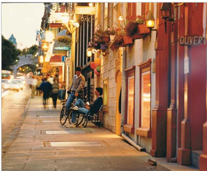
Rue (Street) Saint-Louis

Student Participation – Student participation is strongly encouraged. Travel subsidies and reduced registration fees will be available. Student presenters are eligible to win prizes for the best presentations. The deadline for application is August 1, 2011.